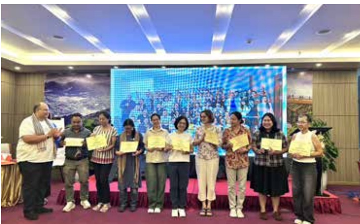
Der feierliche Abschluss: Jede und jeder erhielt ein Zertifikat der Teilnahme. In den fünf Tagen haben sich neue Kontakte entwickelt, viele haben wertvolle Einblicke gewonnen und nehmen kreative Ideen für die eigene Arbeit mit nach Hause.