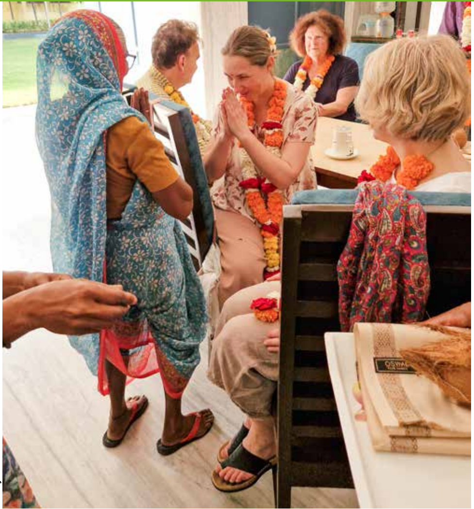
Bei der herzlichen Begrüßungszeremonie im Rainbow Guesthouse.

lich gibt es in Indien moderne Technologien und effizientes Arbeiten, das beweist zum Beispiel die Schnelligkeit, mit der in Nagpur die Metrolinien ins Umland vorangetrieben werden. Doch es gibt eben auch sehr, sehr viele Menschen, die dringend auf die paar Rupien angewiesen sind, die sie mit ihrer Hände Arbeit ver-