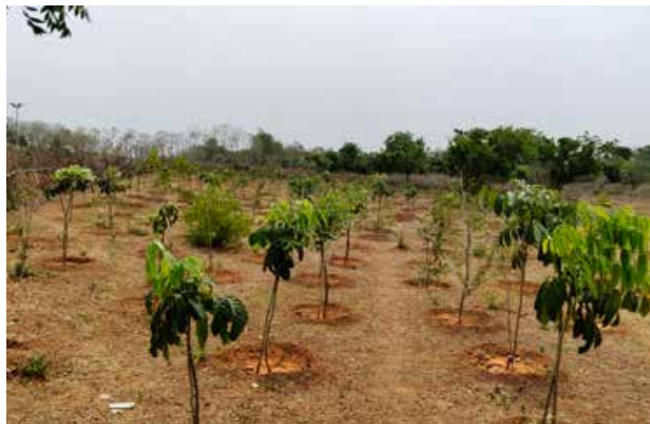
4000 Bäume wachsen auf ehemals brach liegendem Land im Dorf Ammbakkam.

Im Dorf Monnavedu organisierten die Green Champions im Rahmen staatlicher Programme Pflanzaktionen auf Gemeindefeldern und pflanzten 400 Bäume, außerdem motivierten sie 50 Familien dazu, Kokospalmen rund um ihre Häuser zu pflanzen: Die Setzlinge erhielten die Familien kostenlos von einer staatlichen Stel-