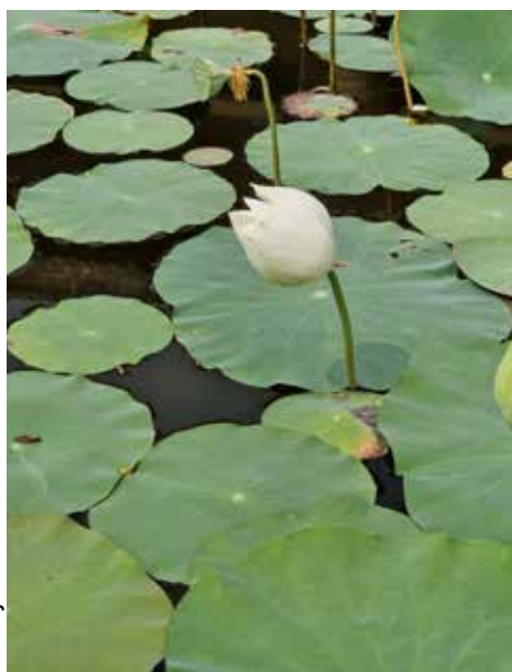
Die Lotusblüte begegnet uns auch in Vietnam.

30 Jahre Deutsch-Indische Zusammenarbeit – und 100 Ausgaben DIZ aktuell. Ein guter Anlass, zurückzublicken, Dank zu sagen und zugleich mit Zuversicht nach vorne zu schauen.