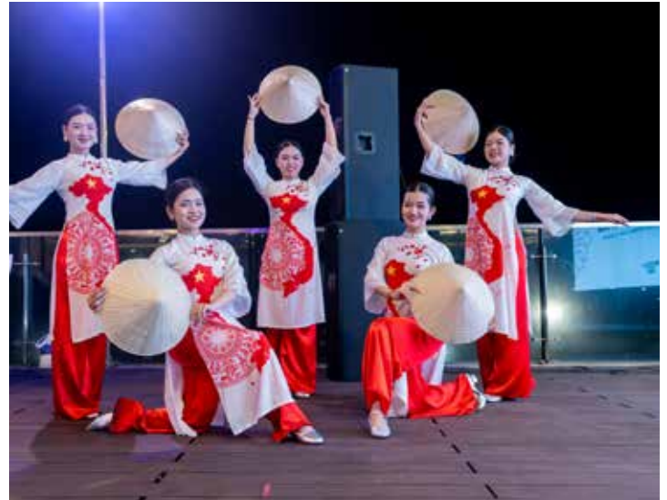
Beim kulturellen Abend stellten die Teilnehmenden gegenseitig Traditionen aus ihren Ländern und Regionen vor. Es wurde viel gesungen und getanzt – und selbstverständlich lernten die jeweils anderen immer die Lieder und Tänze, was manchmal viel Konzentration erforderte, manchmal zu großem Gelächter führte.