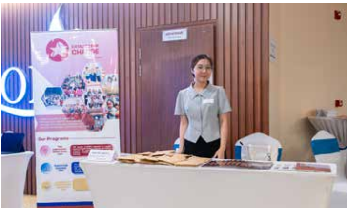
Auf dem »Marktplatz« präsentierten alle Teilnehmenden ihre Arbeit, berichteten den anderen, mit welchen Zielgruppen und zu welchen Themen sie tätig sind. Es entspannen sich intensive Gespräche über die Entwicklungsarbeit, die alle Organisationen leisten – und es entwickelte sich ein Teamgeist, da alle für das gleiche Ziel arbeiten: Lebensbedingungen verbessern für Menschen, die benachteiligt sind.