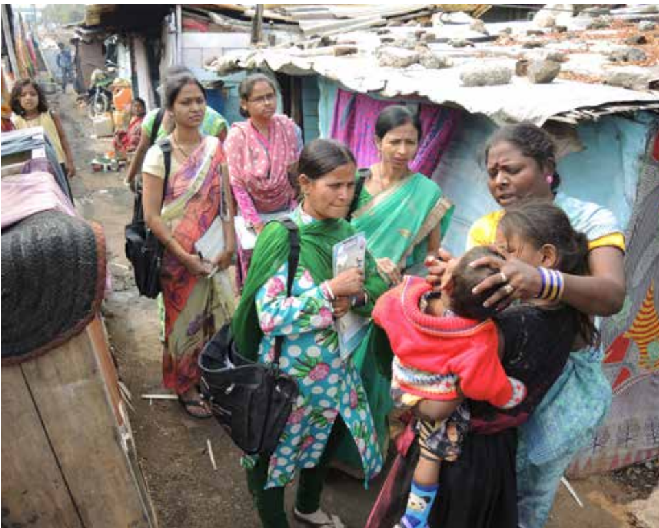
Vor zehn Jahren kümmerte sich der Ecumenical Sangam um die Aufklärung über Lepra und führte auch Untersuchungen durch.

Besonders sichtbar wird die Verbindung lokaler Projekte mit globalen Herausforderungen im Bereich Klima- und Umweltschutz. Aufforstung, Biodiversität, nachhaltige Ressourcennutzung oder Umweltbildung sind längst nicht mehr nur lokale Themen. Sie stehen unmittelbar im Zusammenhang mit internationalen Debatten über Klimagerechtigkeit und nachhaltige Entwicklung.