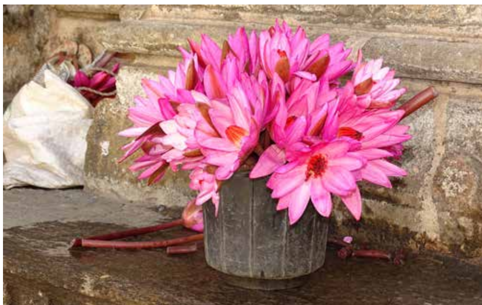
Der Strauß Lotusblüten, aufgenommen im Tempel in Ramtek, symbolisiert für uns gleichermaßen Beständigkeit, Wachstum, Entwicklung.