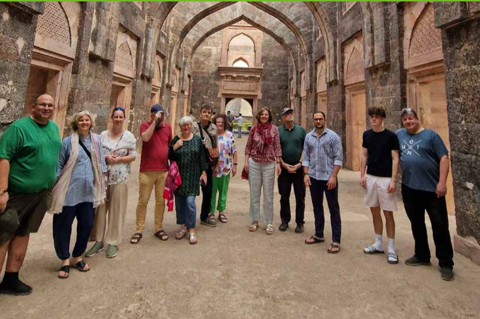
Die Studienreisenden erkundeten im Februar unter anderem die Ruinenstadt Mandu.