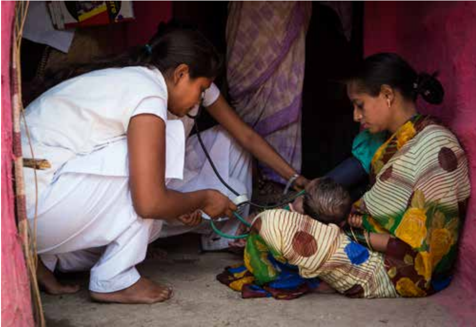
Im Projekt »Mutter-und-Kind-Gesundheit« ging es darum, die Kindersterblichkeit zu reduzieren.

Mit der Verabschiedung der Agenda 2030 und der Sustainable Development Goals (= SDGs oder Nachhaltigkeitsziele) erhielten viele dieser Ansätze einen globalen politischen Rahmen. Ziele wie hochwertige Bildung, Gesundheit, Geschlechtergerechtigkeit, nachhaltige Gemeinden oder Klimaschutz sind keine voneinander getrennten Politikfelder, sondern eng miteinander verbunden. Die praktische Arbeit der DIZ hat diese Zusammenhänge vielfach schon aufgegriffen, bevor sie international unter dem Begriff