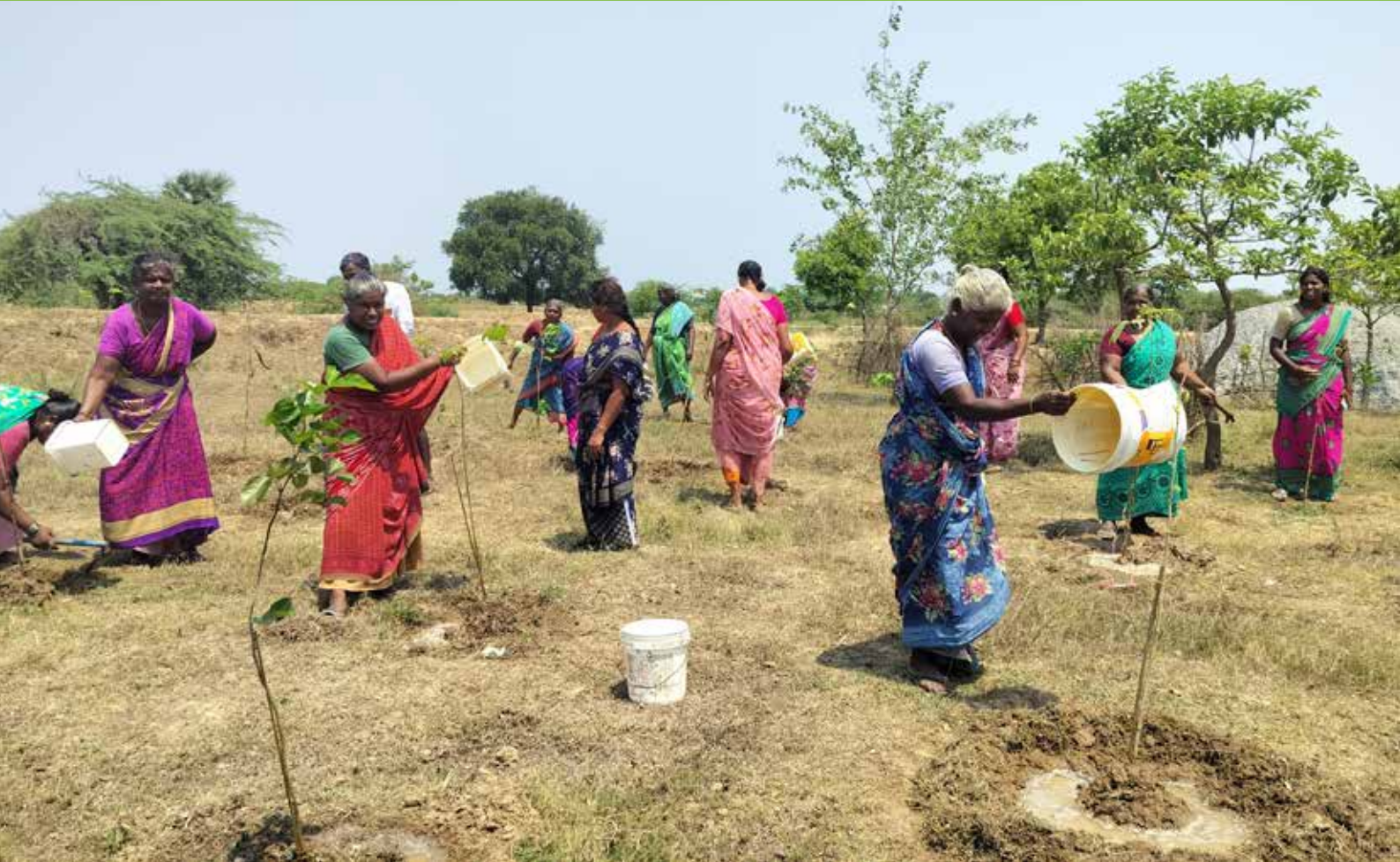
Ein Mikrowald entsteht.