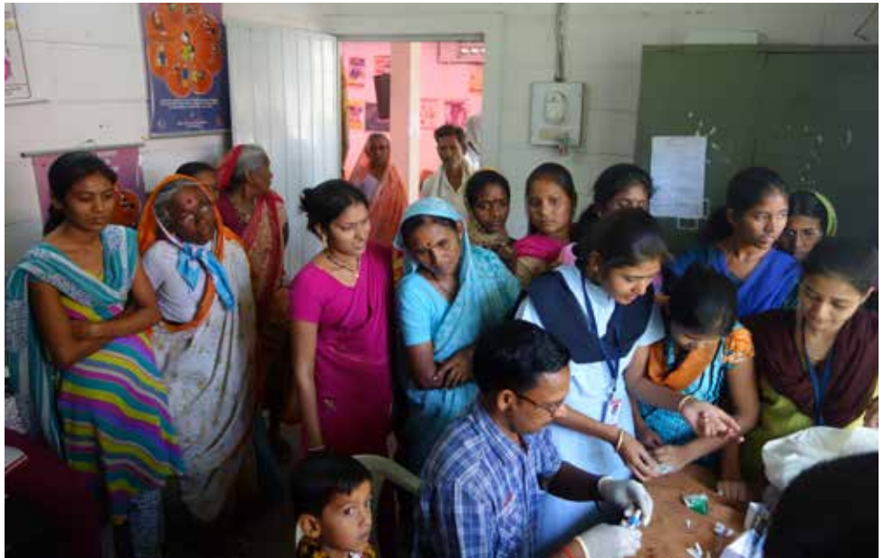
Das Recht auf Gesundheit spielte bei den indischen Partnern immer eine große Rolle in der Projektarbeit: Ehrenamtliche Ärzte fuhrten in die Dörfer rund um Nagur und führten Reihenuntersuchungen durch.

In Bildungsprojekten stand insbesondere die Verbesserung von Zukunftsperspektiven für Kinder und Jugendliche in ländlichen Regionen im Mittelpunkt. Da-