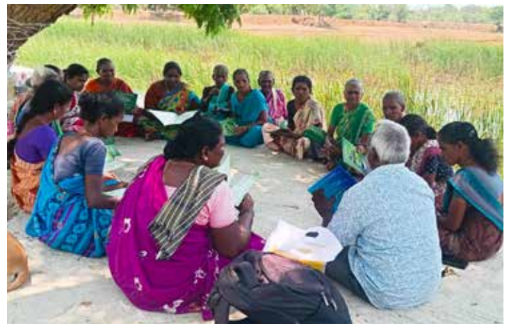
Ein Klimatreffen mit den Green Champions.

Möchtet Ihr IRCDS helfen, Mikrowälder zu pflanzen, Fortbildungen durchzuführen, Green Champions auszubilden und mit all dem noch mehr Menschen zu befähigen, ihre Zukunft klimaresilient und nachhaltig zu gestalten? Dann freuen wir uns über Eure Spende! Evangelische Bank eG IBAN: DE84 5206 0410 0004 0041 08 Stichwort: IRCDS - Klimaschutz