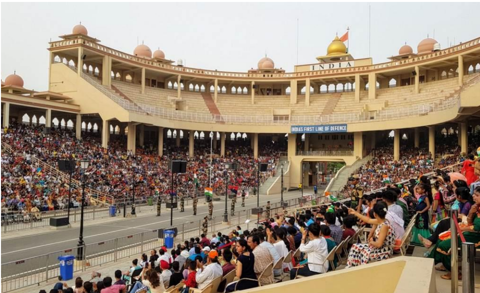
Abendessen und Übernachtung im Hotel N. N.

Jeden Abend zum Sonnenuntergang wird die Grenze zwischen dem pakistanischen und indischen Punjab geschlossen. Die Wagah-Attari Border (oft auch nur Wagah-Border genannt), ist nach den nächsten Dörfern der beiden Länder benannt. Das indische Attari ist etwa 30 km von der Großstadt Amritsar entfernt, Wagah grenzt direkt an die Hauptstadt des pakistanischen Punjab, Lahore. Seit dem Rückzug der Briten und der Spaltung Indiens im Jahre 1947 verläuft eine Grenze zwischen den beiden Staaten. Heute ist die Wagah Border der einzige Ort, an welchem der Übergang zwischen den beiden Ländern zu Fuß möglich ist, natürlich nur mit entsprechenden Visa. Auch die Uhrzeit muss stimmen, denn jeden Abend zum Sonnenuntergang wird die Grenze für den Übergang geschlossen. Von beiden Seiten ist es jedoch möglich, einen kleinen Blick auf das jeweils andere Land zu werfen. Der Grenzübergang ist aufgebaut wie ein Stadion, allerdings mit zwei metallenen Toren in der Mitte. Jeden Abend versammeln sich hier Touristen, Schaulustige und stolze Patrioten, um das eigene Land anzufeuern oder über die geladene Stimmung zu staunen. Zum Sonnenuntergang werden die Flaggen der Länder eingeholt und die Grenze bis zum nächsten Tag geschlossen. Vorher jedoch tobt die Menge.