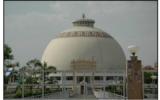
Deeksha Bhoomi - Buddhistische Universität

Nagpur , im Bundesstaat Maharashtra , liegt am Fluß Nag und bildet den geographischen Mittelpunkt Indiens. Die heutige Stadt wurde von einem regionalen Fürsten im frühen 18. Jahrhundert gegründet und wurde auch dessen Hauptstadt. Aber 1817 kam Nagpur unter britischen Einfluß. 1853 ging die Stadt endgültig in britischen Besitz über; diese machten Nagpur wiederum zur Hauptstadt der „Central Provinces“ (1867). Seit 1960 ist Nagpur jedes Jahr für zwei Wochen „Winterhauptstadt“ von Maharashtra.